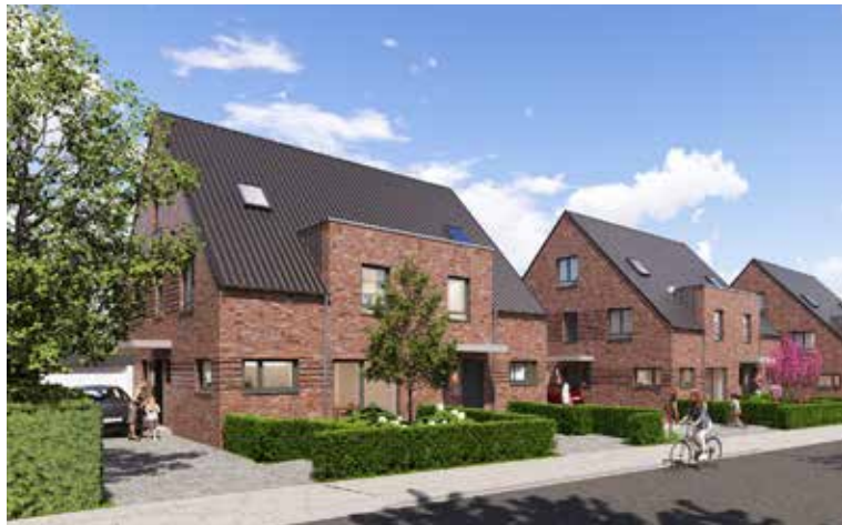
Waldbeerenberg III ca. 50 Einfamilienhäuser 5-6 Zimmer, ca. 130-140 m 2